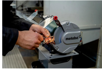
DS 150 M 804150